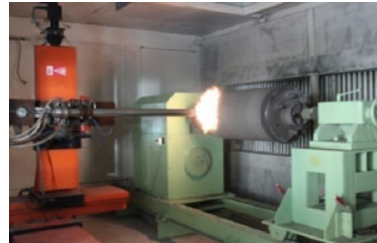
Metalización por detonación (DGS): Material