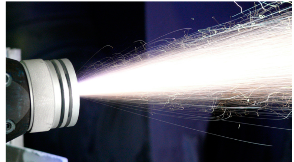
Metalización por arco eléctrico (AS): Material