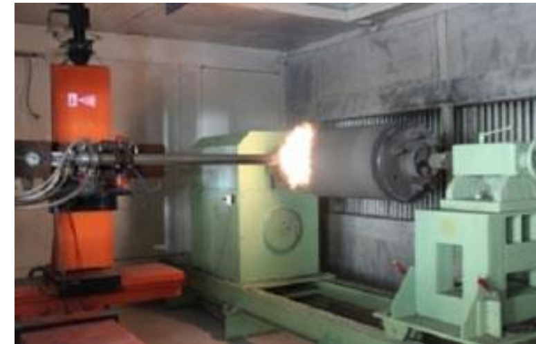
Metallisatie door detonatie (DGS): Uitrusting