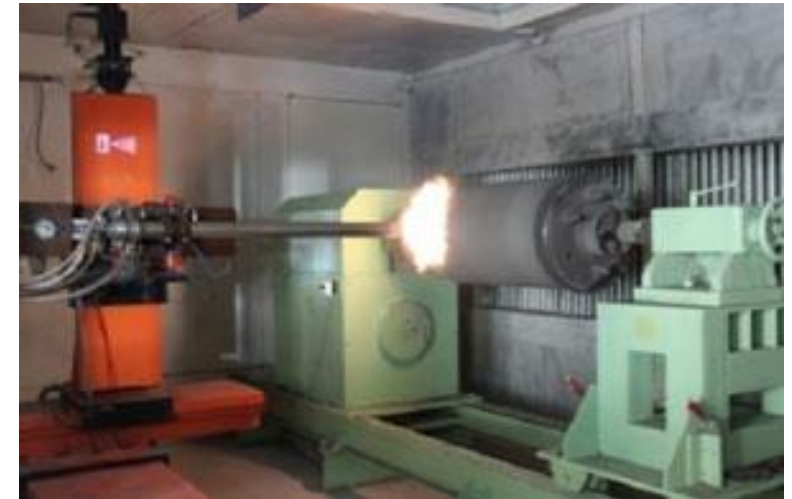
Métallisation par détonation (DGS): Equipement