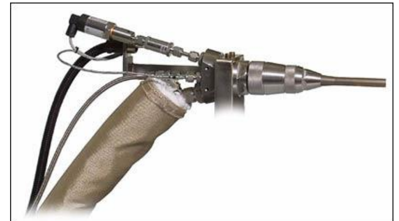
Projection à gaz froid (CGS): Technique