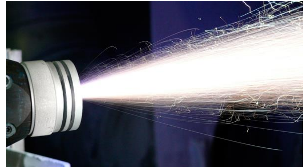
Métallisation au pistolet à arc électrique (AS): Equipement